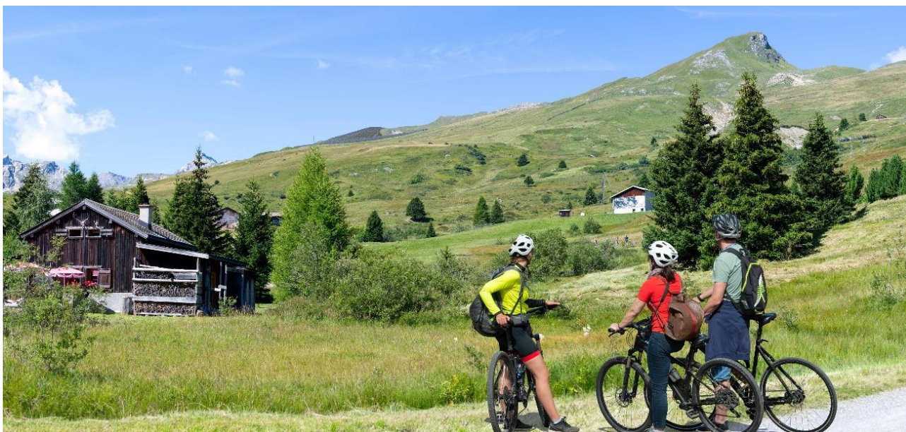
Vista d'avent da Radons: angal ena pitschna part digl implant è visibla / Sicht aus Radons: Nur ein kleiner Teil der Anlage ist sichtbar