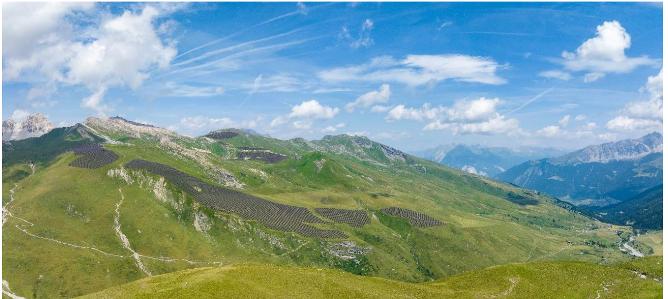
Vista or dall'aria: uscheia ègl da nign li visibel / Ansicht aus der Luft: So von keinem Standort aus sichtbar