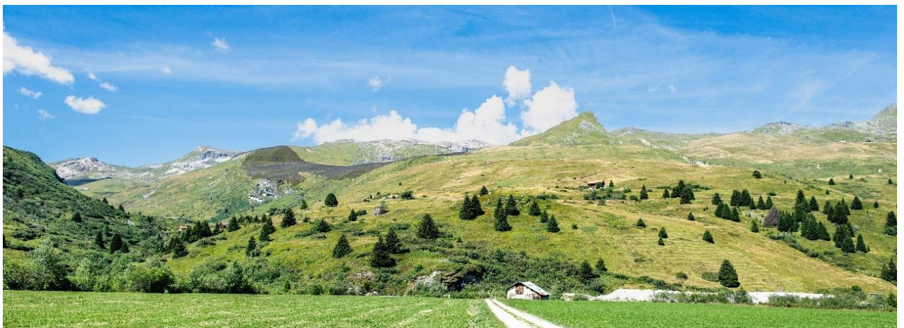
Vista davent da Curtegnas / Sicht aus Curtegnas