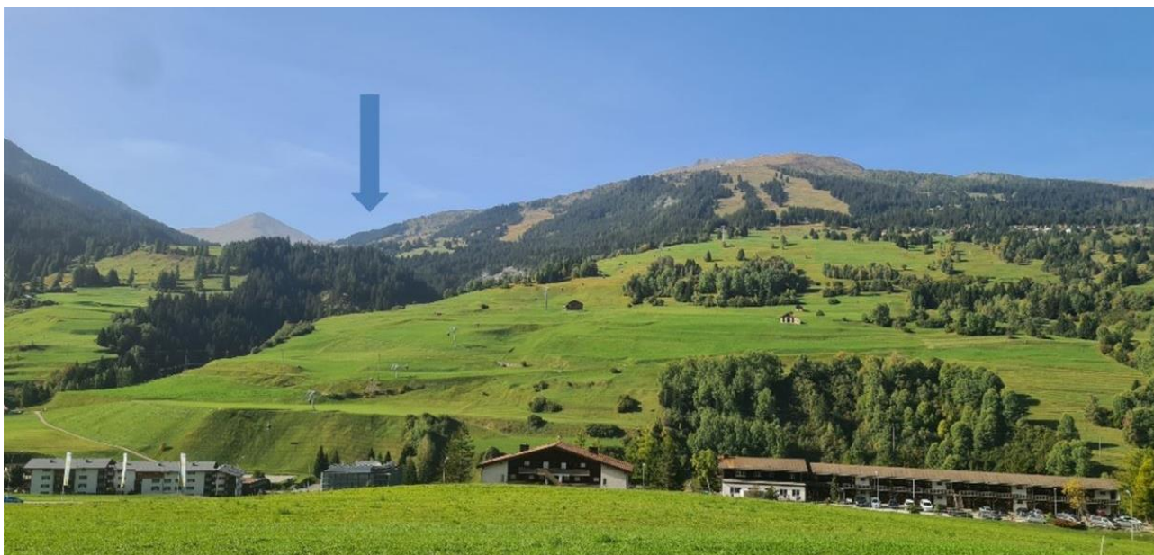
Vista d'avent da Savognin: igl implant fotovoltaic è betg visibel (la frezza mossa la direcziun, noua tg'igl implant sa catta / Sicht aus Savognin: Die Photovoltaikanlage ist nicht einsehbar (Pfeil zeigt die Richtung an, wo sich die Anlage befindet)