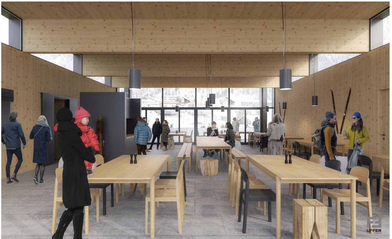
Visualisaziun 4: interior dall'ustareia nova La Nars