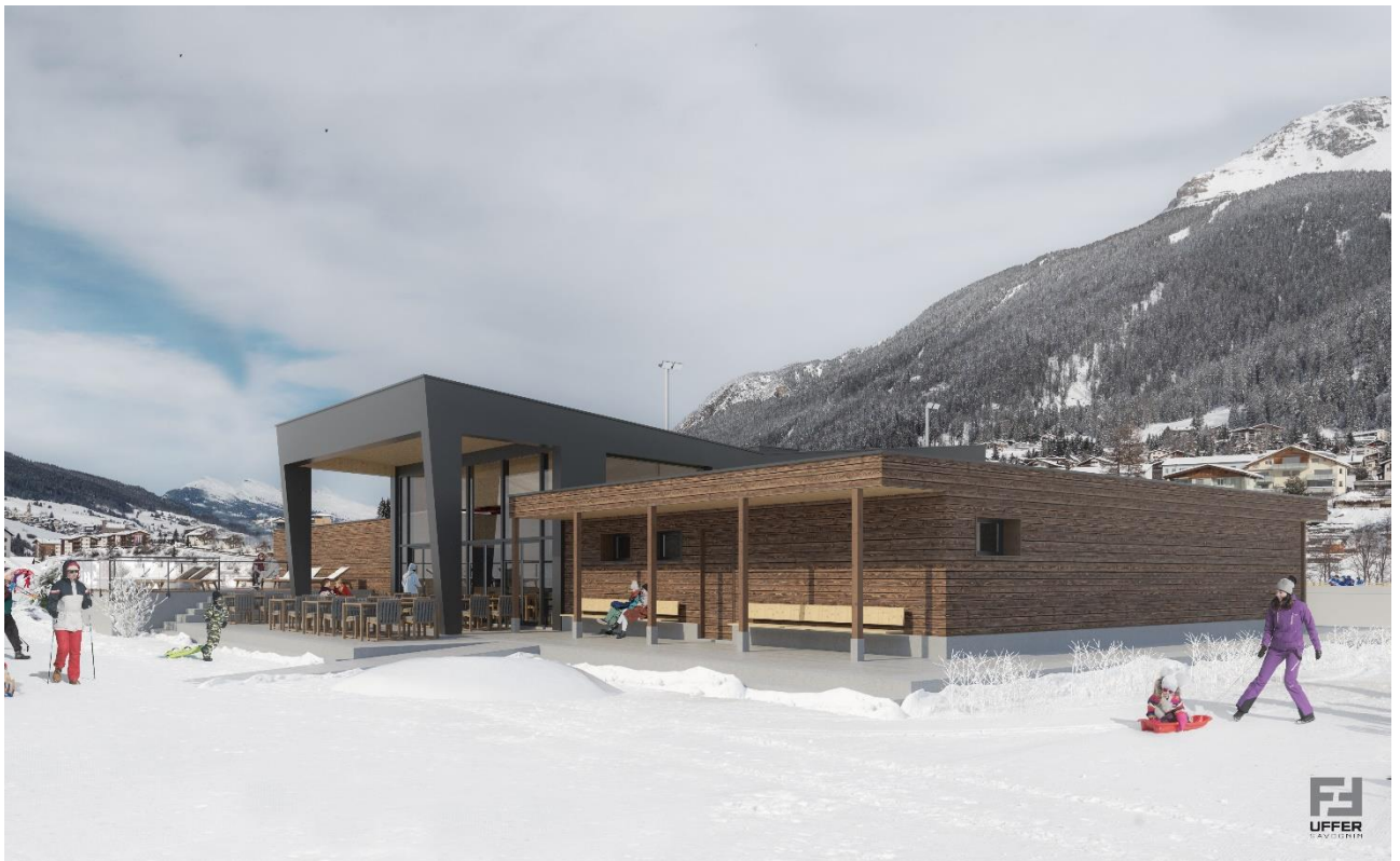
Visualisaziun 2: ustareia e bietg da menaschi nov, vista digl paradis da skis per unfants La Nars vers nord Visualisierung 2: Neues Restaurant- und Betriebsgebäude, Blick vom Kinderland La Nars talabwärt