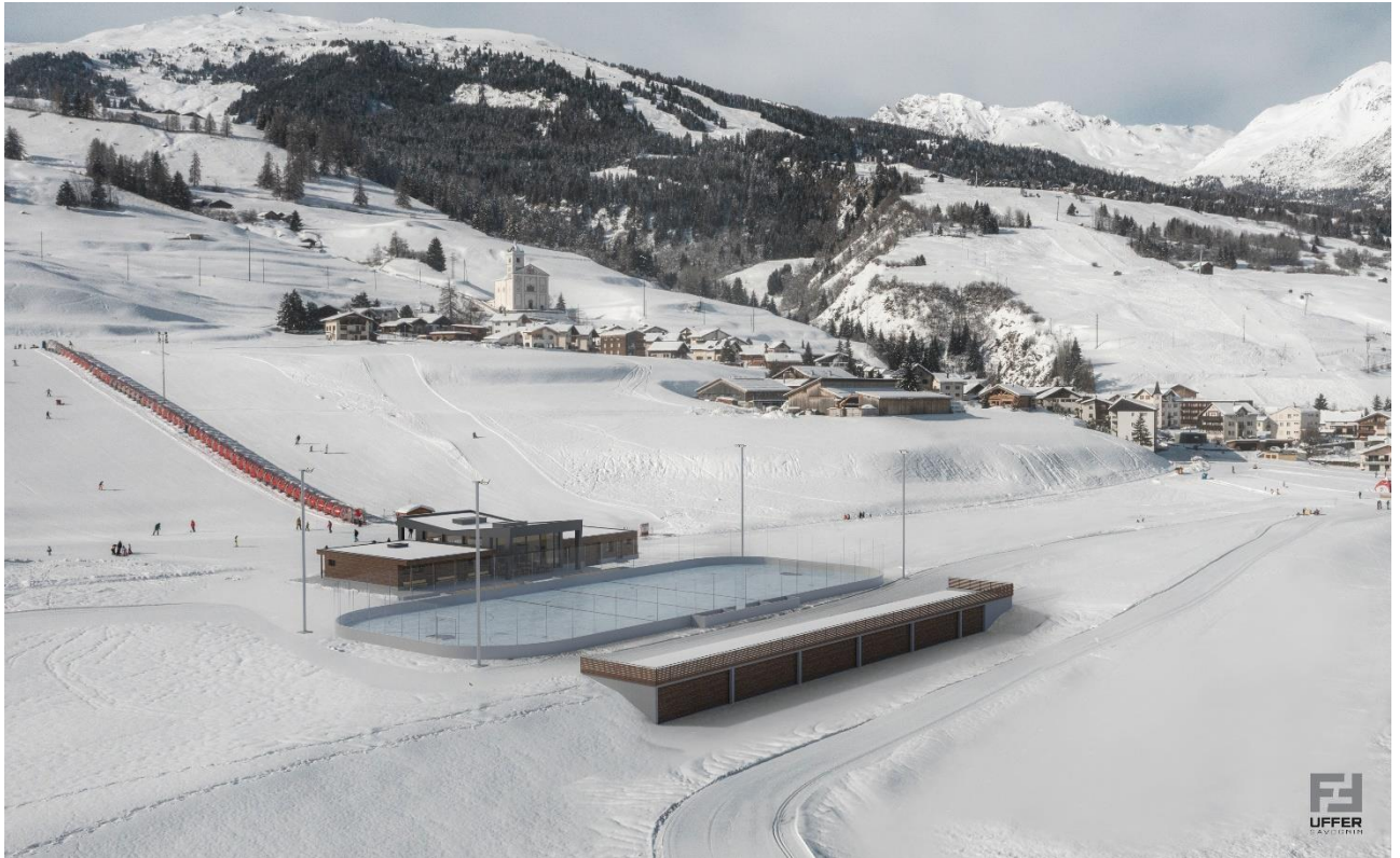
Visualisaziun 3: arena da sport d'anviern La Nars cun magasin, patinera e nova ustareia e bietg da menaschi