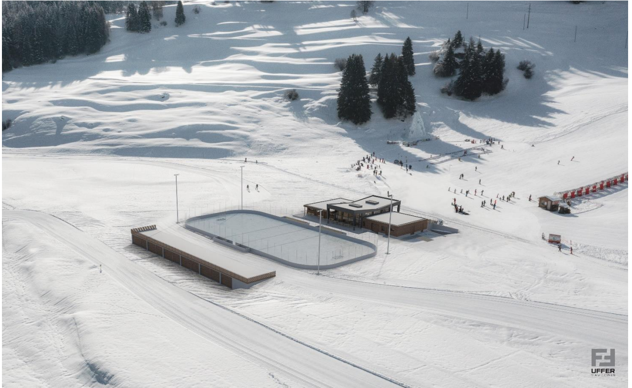
Visualisaziun 1: arena da sport La Nars cun ustareia e bietg da menaschi nov agl center Visualisierung 1: Sport-Arena La Nars mit neuem Restaurant- und Betriebsgebäude im Zentrum