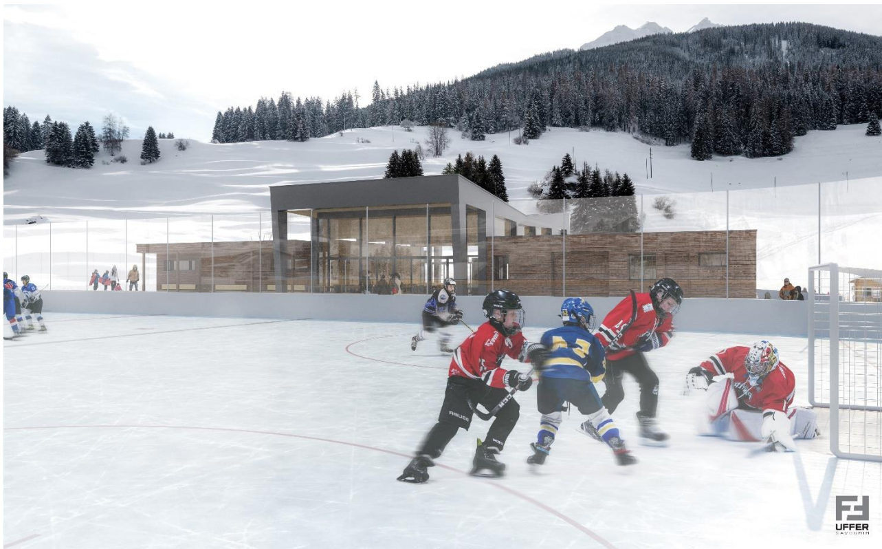
Visualisaziun 5: gi da hockey sen la patinera nova a La Nars

Visualisierung 5: Hockey-Spiel auf dem neuen Kunsteisfeld in La Nars