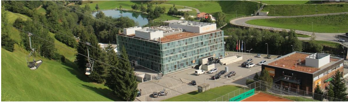
Hotel Cube, ca. 2010

Per la destinaziun Val Surses ò la sarada digl hotel Cube diversas consequenzas negativas: