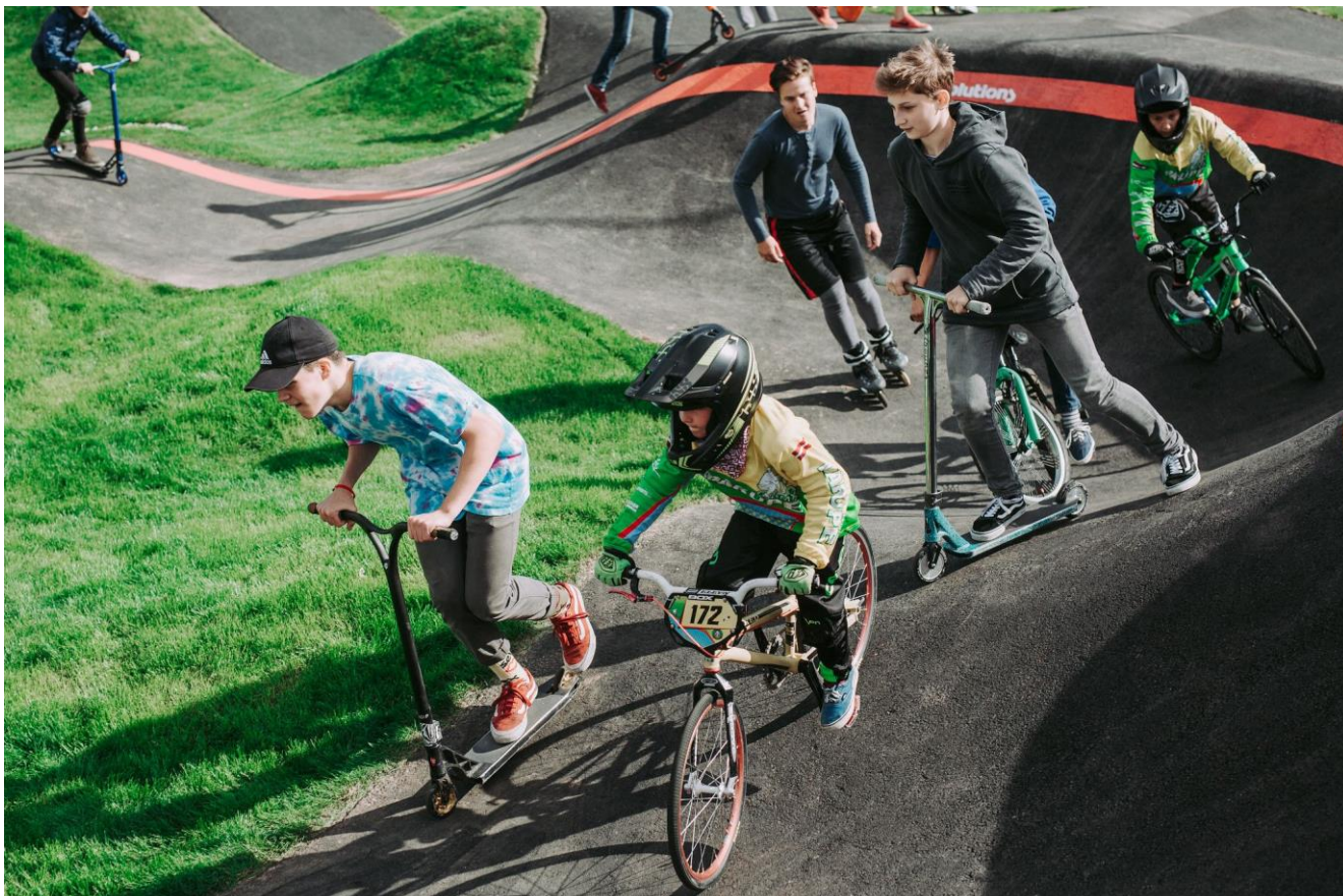
Maletg simbolic.

Igl percurs duess neir realiso sen ena surfatscha da radond 1'730 m 2 agl Lai Barnagn a Savognin, visavi agl implant da minigolf sen la parcella nr. 3920. Chella parcella è an possess digl cumegn e sa catta ainten la zona per edifezis e stabiliments publics.